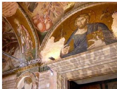
Eglise Saint- Sauveur-in-Chora

ESCAPADE : 5 JOURS à ISTANBUL 20 au 24 mai 2012 5 jours dans une ville trépidante