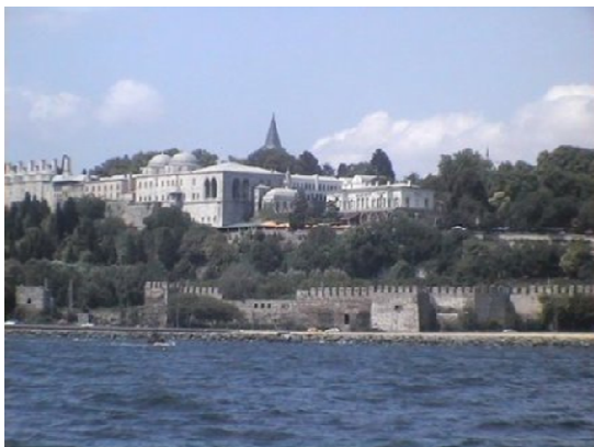
Istanbul, le Palais de Topkapi